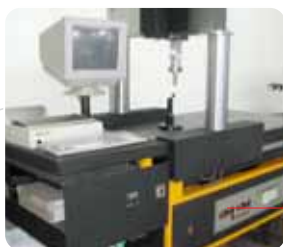
Macchina misurazione MDM Mechatronic Catrim