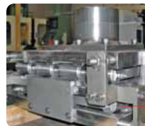
Attrezzatura per collaudo molle per carrelli settore Veicoli Ferroviari