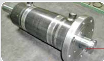
Cilindri per Macchine Curvaprofilati