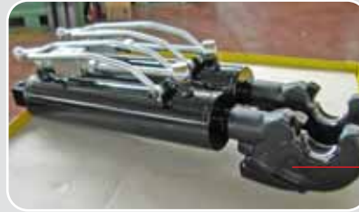
Terzo punto idraulico con gancio rapido CBM 3 cat. NEW HOLLAND

Terzi punti e tiranti verticali idraulici per trattori di tutte le gamme e potenze