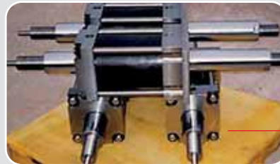
Cilindri per presse di estrusione plastica