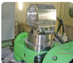
Lavorazione 5 assi CNC