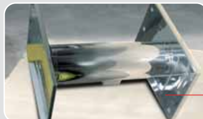
Cilindro in acciaio INOX 316 per nautica da diporto e passerelle

Cilindri speciali su specifiche del cliente