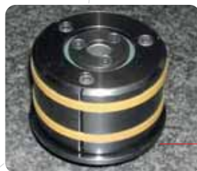
Testate meccaniche a settori autoespandenti con rotazione su cuscinetti