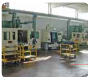
Settore centri di lavoro CNC

Possiamo soddisfare tutte le vostre richieste dal singolo pezzo fino alla serie. La richiesta di cilindri speciali viene sottoposta al nostro ufficio tecnico che ne elabora il progetto.