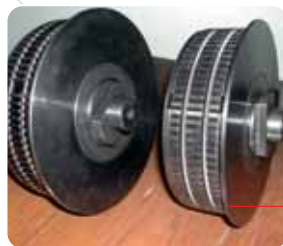
Testate meccaniche a settori autoespandenti