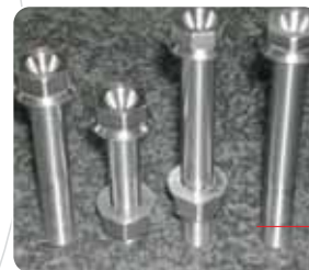
Componenti in titanio per settore Tuning Motociclistico