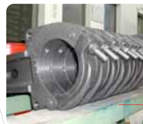
Componenti per settore Macchine Tessili