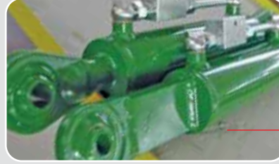
Terzo punto e tirante laterale JOHN DEERE