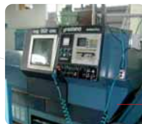
Tomio CNC Graziano SAG 406 Ø tornibile 350 x 1300 mm