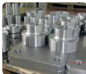
Componenti per settore Converting Machinery