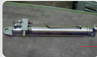
Cilindro sollevamento braccio