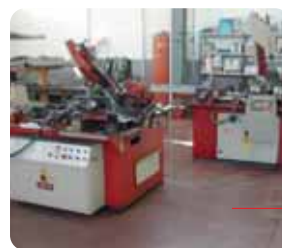
Settore taglio con diametro da 20 a 280 mm