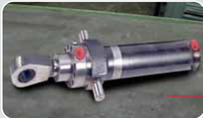
Cilindro movimentazione e cantieristica